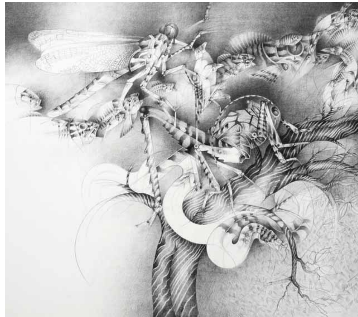
Dibujo Primer Premio Adquisición