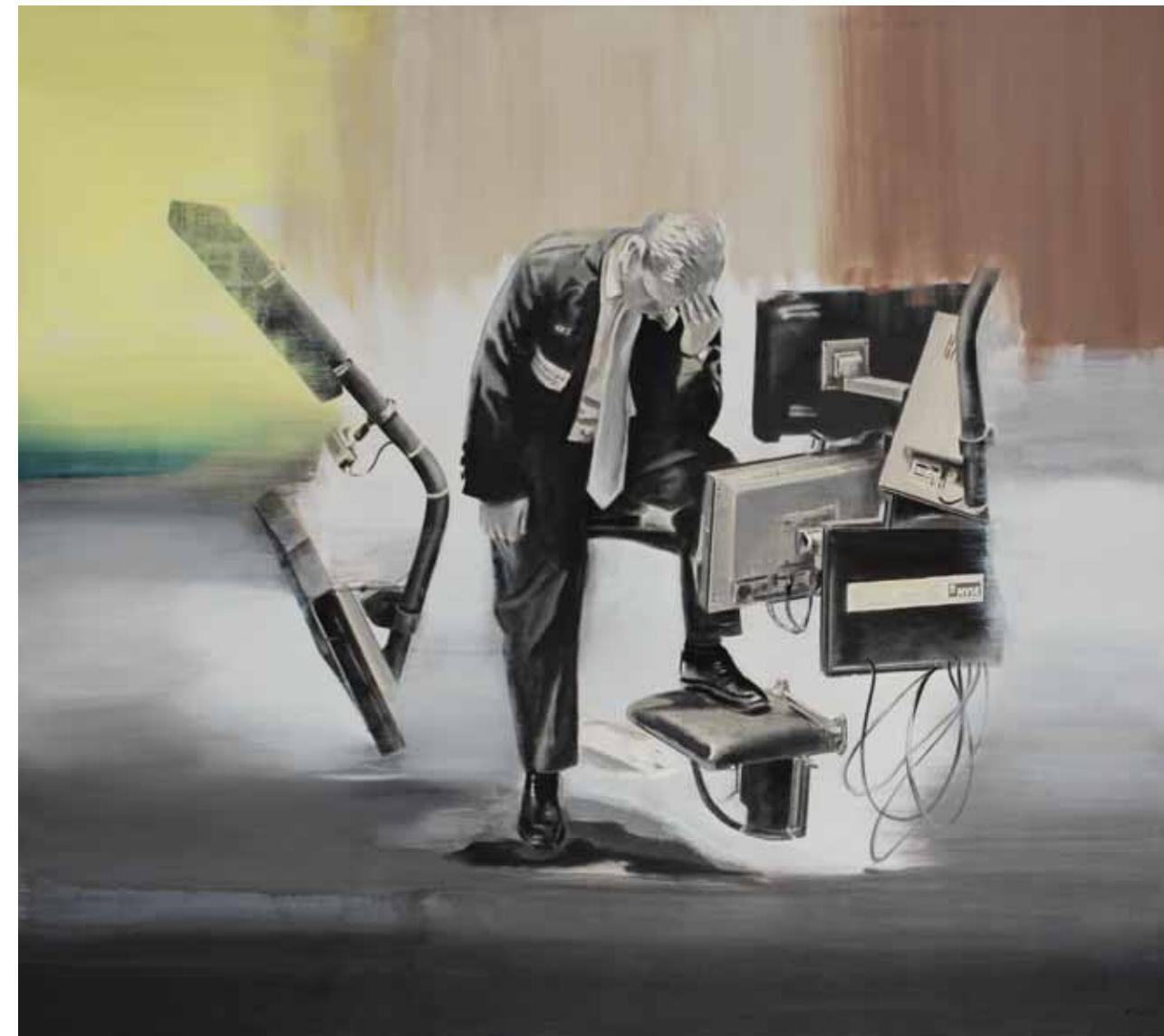
Pintura Primer Premio Adquisici3n