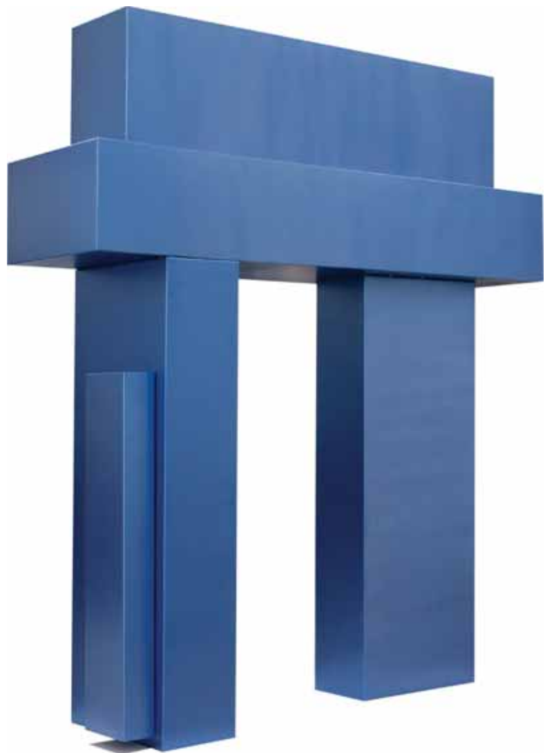
Escultura Primer Premio Adquisición